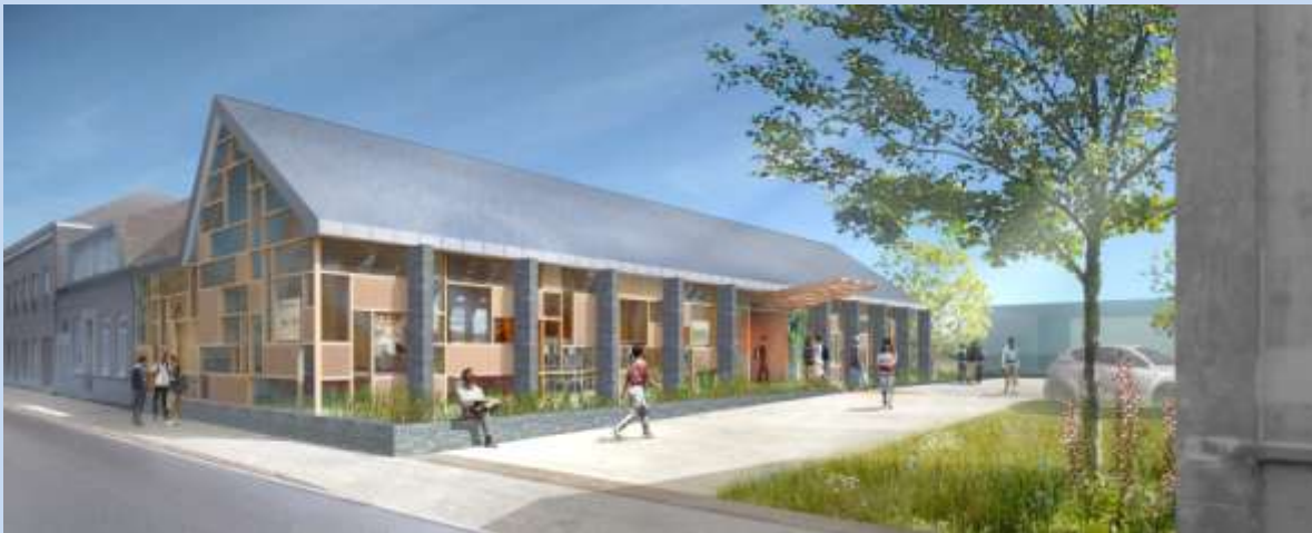
Une vue de la façade et du pignon qui donne sur la rue Jean LEBAS ainsi qu'une coupe de l'intérieur du bâtiment.

En novembre 2012, « L'AGENCE S », Architecte basé à Wasquehal, avec son projet de construction d'une typologie classique mais avec un traitement original notamment grâce à ses soubassements et poteaux en briques grises, sa façade en vitrage et parties pleines en bois et son toit en ardoise, a conquis la commission. Après l'adoption par le Conseil Municipal de l'Avant Projet Définitif, qui aura lieu en juin, un appel d'offre sera lancé en juillet et le choix définitif du constructeur interviendra en septembre.